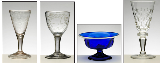
Til venstre WillasWinthers gravyr av Nøstetangen 1751. Glass fra Nøstetangen, Hurdal, Gjøvig og Hadeland